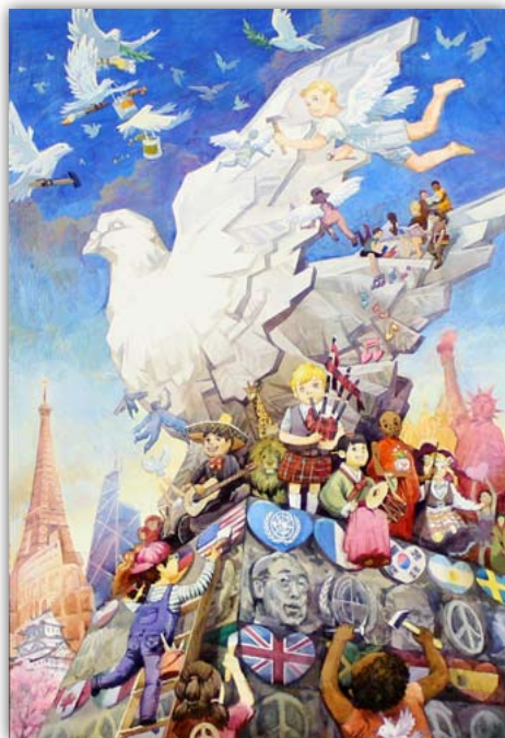
2014 ~ 15 年度大賞受賞者 ウェイ・ジン・チエン 13 歳 中国

2015 ~ 16 年の平和ポスター・コンテストのテーマは、「 平和を分かち合おう 」です。11月15日(地区ガバナーへの締切り日)の時点で11 ~ 13 歳の生徒に参加資格があります。前年度(テーマ「平和・愛・理解」)の国際大賞および優秀賞のポスター(23名のうち上位6名)を紹介しします。ちなみに、1名の国際大賞受賞者には5,000ドルが授与され、特別授賞式に招待され、23名の優秀賞受賞者には、それぞれ500米ドルの賞金と表彰状が贈られます。