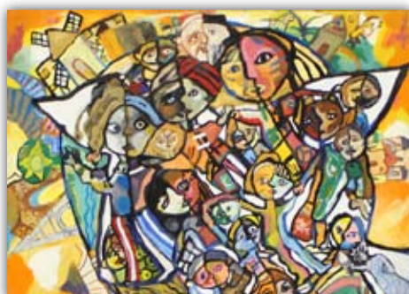
2014 ~ 15 年度優秀賞受賞者 デイビー・アレクサンダー・ロペス・ アランゴ 12 歳 コロンビア