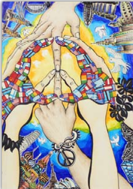
2014 ~ 15 年度優秀賞受賞者 ユジ・ヤン 12 歳 中国