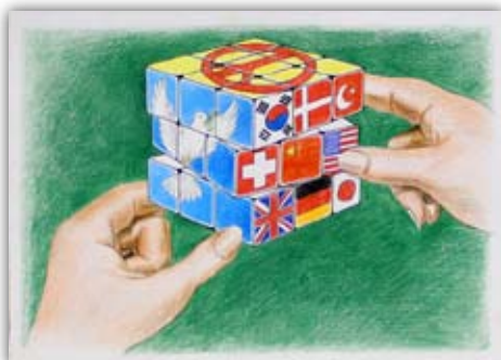
2014 ~ 15 年度優秀賞受賞者 インハオ・ファン 12 歳 中国