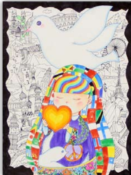
2014 ~ 15 年度優秀賞受賞者 イーニン・リ 12 歳 中国