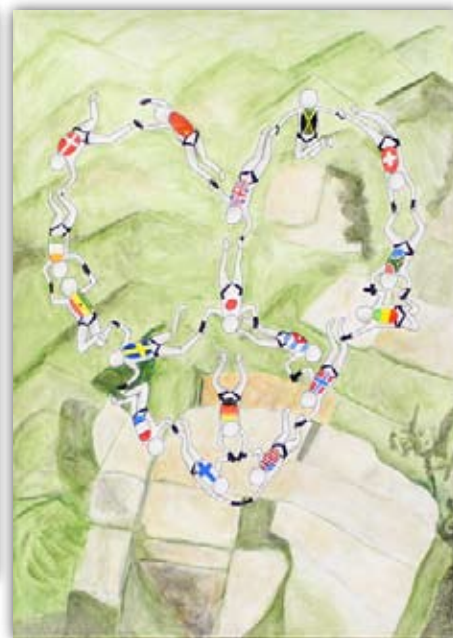
2014 ~ 15 年度優秀賞受賞者 ヨンナ・マータ 13 歳 フィンランド